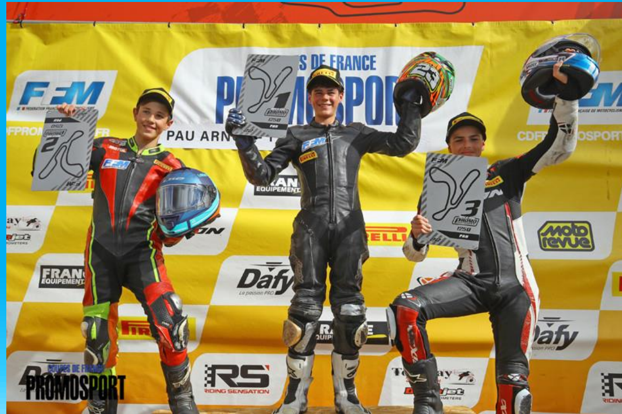
Ma 1 ère victoire sur le circuit de Pau Arnos

Je suis prêt pour cette nouvelle saison! J'ai appris de mes erreurs et mes expériences m'ont aidé à grandir! Je m'entraîne dur pour réussir parce qu'on m'a toujours appris que le talent c'est d'abord et surtout beaucoup de travail !!